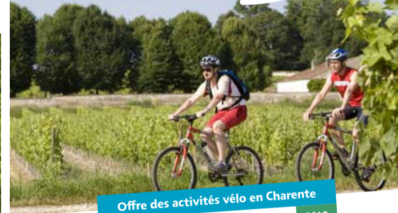
Offre des activités vélo en Charente 2019

sportsdenature16.lacharente.fr www.lacharente.fr Département de la Charente - Officiel